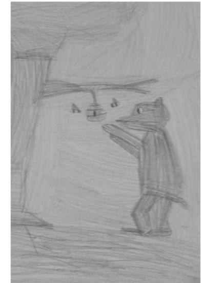
Garamszegi Gergő medvéje