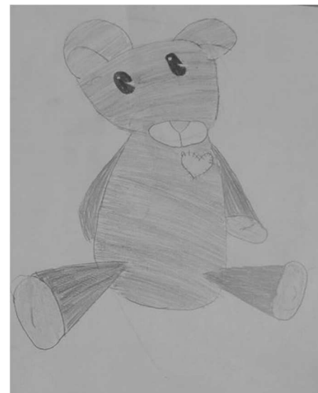
Garamszegi Hanga rajza