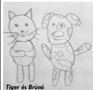
Tiger és Brúnó

Másnap elindult az iskolába. A házuk előtt megtörtént a csoda! Egy citromsárga kiscsibe szaladgált az úton.