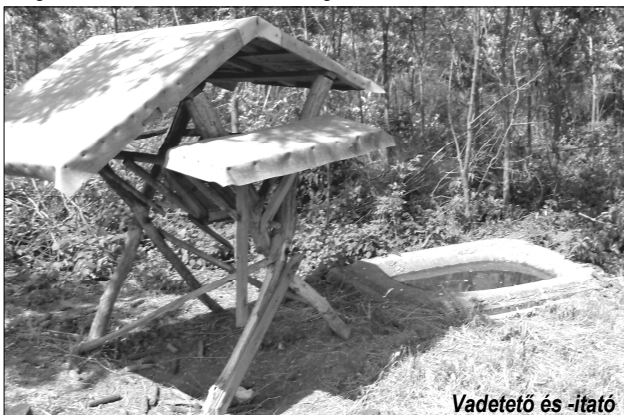
Vadetető és -itató

Gazdálkodásuk kis költségvetésű. A társaság a tagdíjakból, vadásztatásból és a vadhús értékesítéséből tartja el magát. Kiadásukba beletartozik a vadőrök fizetése, a téli etetés, a minimális vadkár, magaslesek és etetők karbantartása, amit gyakran kell végezni a vandalizmus miatt. A gazdáknak hála az etetésre és a vadkár nem megy el annyi bevétel, mert a vadászok egy 3,2 és