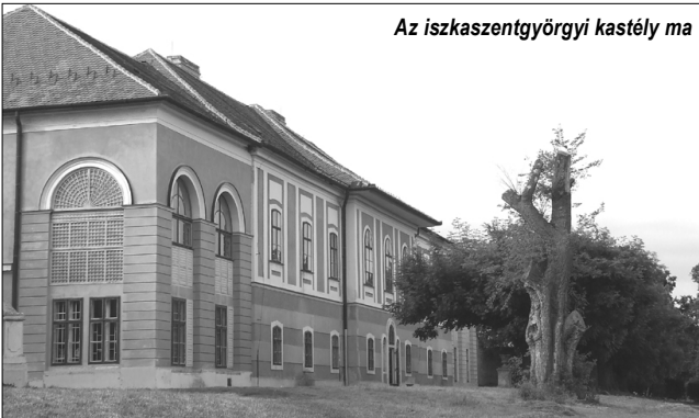
Az iszkaszentgyörgyi kastély ma

A gróf egyenesen az erdő közepébe ment, ahol favágói serényen dolgoztak.