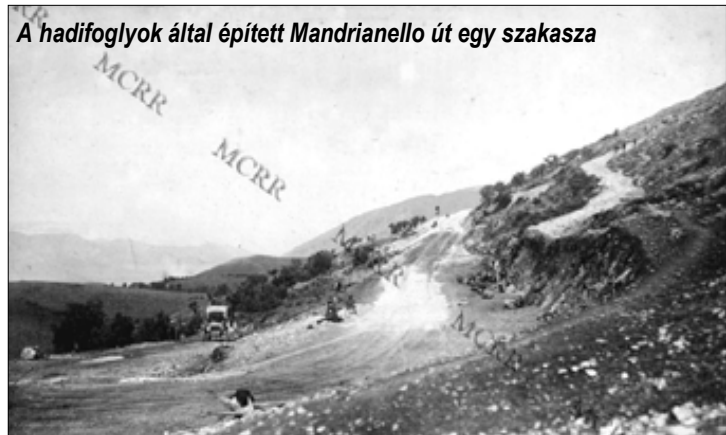
A hadifoglyok által épített Mandrianello út egy szakasza