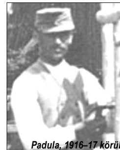
Padula, 1916-17 körül

„Ismerem a Dél-Tirolt, ismerem az Észak-Tirolt, az Alpokat, a nótám is onnan van...” – Nagyapám a padulai fogolytábor képein