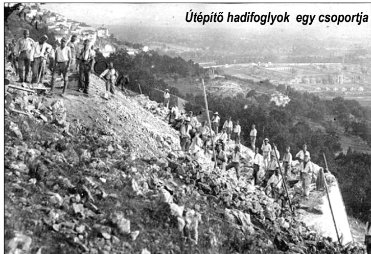
Útépitő hadifoglyok egy csoportja