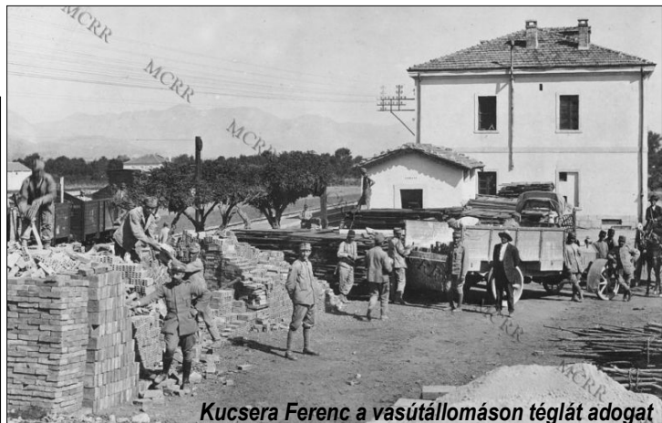
Kucsera Ferenc a vasútállomáson téglát adogat