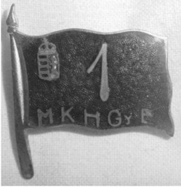
Az I. honvéd gyalogezred sapkajelvénye