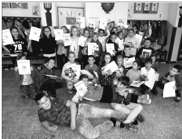
A nyertes pályázók egy csoportja