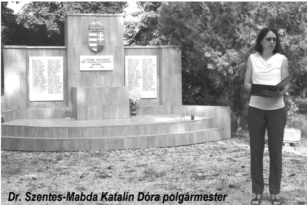
Dr. Szentés-Mabda Katalin Dóra polgármester

A magyar hősök emlékének megörökítéséről és a magyar hősök emléknapjáról szóló 2001. évi LXIII. törvény a magyar hősök emléknapjává nyilvánította minden esztendő májusának utolsó vasárnapját. A törvény kimondja, hogy „a magyarság ezer esztendeje alatt, fegyverrel vagy fegyvertelenül harcoló valamennyi férfi és nő, aki a magyar hazá védelmére kelt, tetteivel kiérdemli a tiszteletteljes megemlékezést ezen napon”.