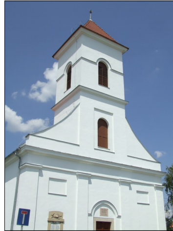
Sukoró (református templom, ingókövek)