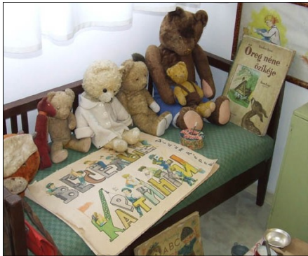
Martonvásár (óvodamúzeum, kastélypark)